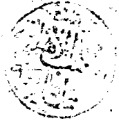
صفحة العنوان من مخطوطة دارالكتب الظاهرية بدمشق

مستخرج من كتاب جامع الاحكام دارالكتب دمشق ١٢٨